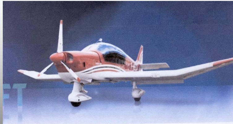
FINCH AIRCRAFT Diésel (CDN Classique)