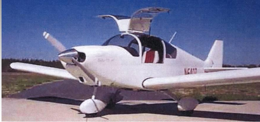
Le ZENAIR CH 640 (CNRA Métallique)