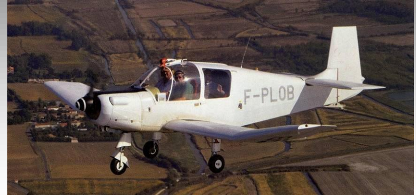
DELEMONTEZ D-103 (CNRA Classique)