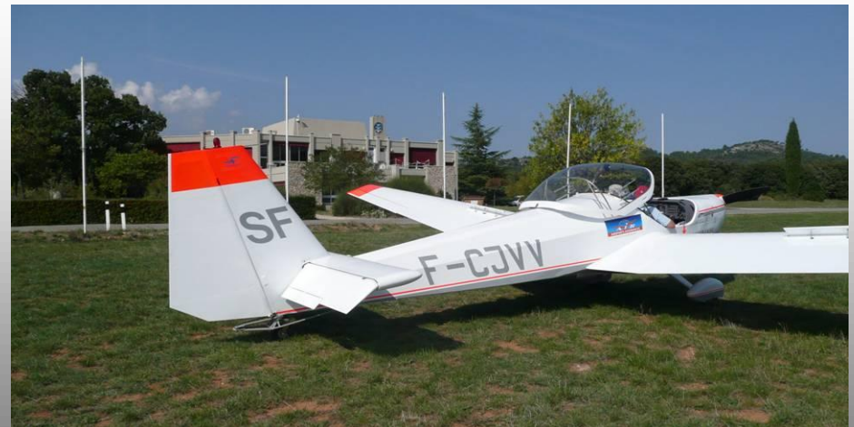
LE SF 25 (CDN)